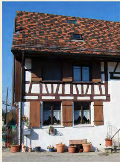
Erstes Gerlikoner Schulhaus im Oberdorf