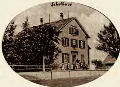
Gerlikone Schulhaus von 1875